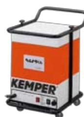
ヒュームコレクター