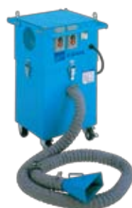
ジェットヒューム