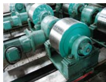
10t 鉄輪ターニングロールがあります。 お問い合わせください。