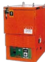
大型溶接棒乾燥機